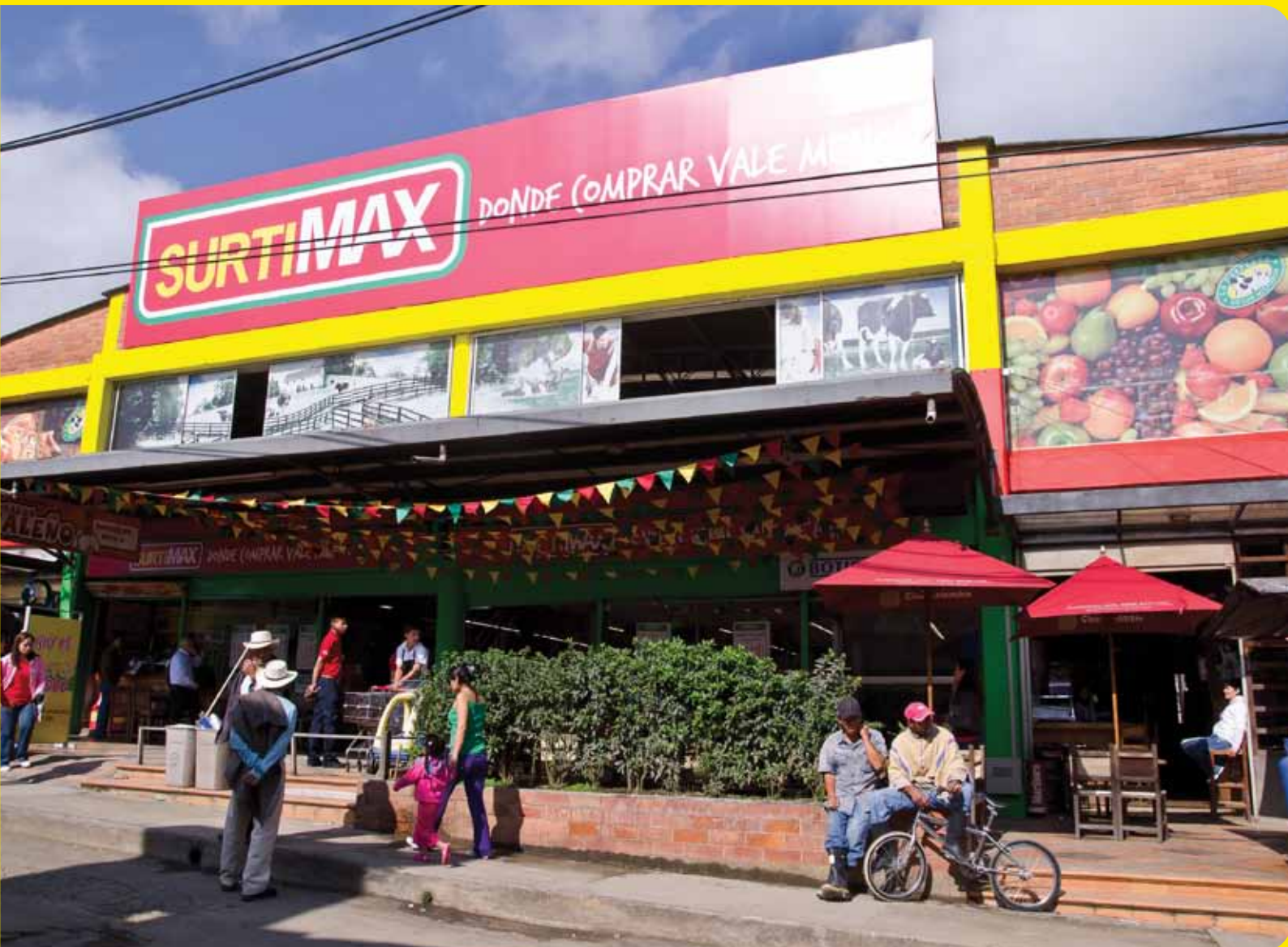
Nuevo almacén Surtimax en ciudad intermedia.