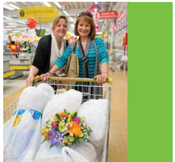
Trabajamos para que nuestros clientes regresen.

El 16 de marzo se llevó a cabo la Asamblea General de accionistas de la Compañía. Todas las proposiciones presentadas por la administración, fueron aprobadas, incluyendo un incremento de dividendos del 45%.