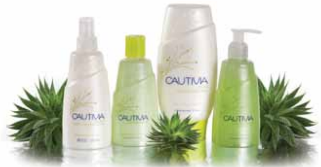
Cautivia: la nueva marca propia de Éxito.

La Compañía continuó con la introducción de productos y marcas para capturar nuevos clientes. Grupo Éxito en alianza y acuerdo exclusivo con Universal music, introdujo el álbum más aclamado del año, MDNA de Madonna en los almacenes Éxito.