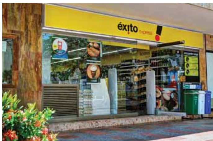
Éxito Express Las Velas, el primer almacén del formato en Cartagena.

Durante el trimestre se llevó a cabo la Fiesta escolar Éxito y el Aniversario Éxito en los almacenes de la Compañía, con más de 24 millones de productos en oferta en 156 puntos de venta.