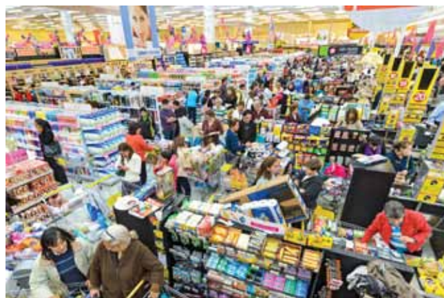
Colombia disfrutó el Aniversario Éxito

Surtimax San Pedro de los Milagros y San Cristóbal en Antioquia; Bazurto en Cartagena; Malambo y Baranoa en Barranquilla; y Matatigres y Las Ferias en Bogotá.